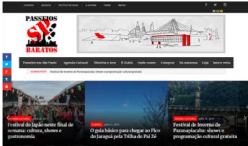
Página inicial do blog

:: divulga as atrações da cidade e chama atenção para a beleza, riqueza histórica e áreas verdes que cercam a metrópole;